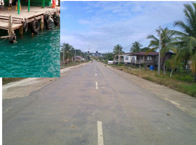
Jalan Berturap di Pulau Sebatik, Tawau