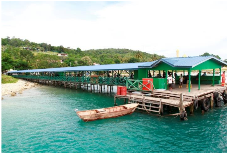
Jeti di Pekan Karakit, Pulau Banggi, Kudat

Pada masa yang sama, Syarikat meneruskan pembangunan fasa ke-3 projek di Apas Balung, Tawau. Pembangunan juga disasarkan semula ke kedai-kedai lama di pekan Tenghilan Tuaran, Kg Pelantong di daerah Beluran serta menjangkau ke pulau Karakit, Kudat. Satu lagi kawasan pulau yang menjadi tumpuan untuk pembangunan lot kedai adalah di Pulau Sebatik, Tawau. Secara keseluruhannya, pembangunan yang dilaksanakan dalam tempoh Rancangan ini bersifat menyeluruh.