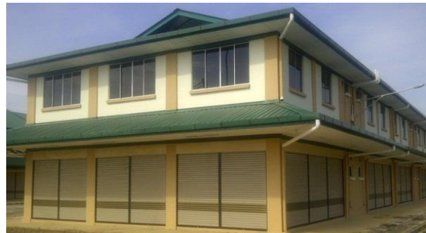
Rumah Kedai Sosio Ekonomi Apas Balung Fasa I (gambar kiri) & Fasa II (dalam proses pembahagian kedai)